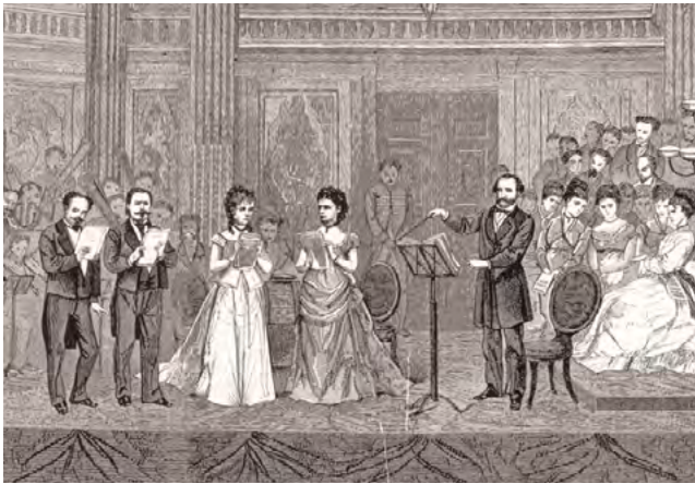
Verdi dirigiert sein Requiem 1974 an der Scala

lichen Solisten unterstützt wird. An der Stelle „Liber scriptus“, dem ersten großen Solo der Mezzosopranistin, hatte Verdi ursprünglich eine Chorfüge vorgesehen. Aber seine Kunst in dieser Königsdisziplin der Kompositionstechnik hat er ja schon im A-cappella-Chor des ersten Satzes, im Doppelchor des Sanctus und schließlich im Libera me bewiesen. Hier führt die Sopranistin das Hauptthema auf dem Höhepunkt mit voller Kraft zum hohen C über Chor und Orchester hinweg, bevor die Musik wieder abklingt und mit einem gedämpften und ergreifenden Flehen um Erlösung endet.