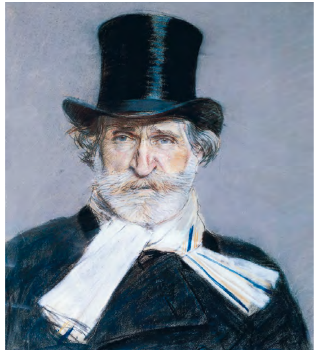
Giovanni Boldini, Giuseppe Verdi 1886 © Galleria Nazionale d'Arte Moderna e Contemporanea

„Zu theatralisch“ und deshalb „unliturgisch“, gar „frivol“ bis hin zu „blasphemisch“ – diesen Pauschalvorwürfen ist die italienische Kirchenmusik des 19. Jahrhunderts allenthalben ausgesetzt, und zwar schon zu ihrer Zeit. Tatsächlich stammt ein großer Teil der geistlichen Musik Italiens damals von ausgemachten Opernkomponisten, die für die Kirche eher durch Zufall, das heißt auf Grund von Einzelaufträgen komponieren. Eine enge Stilverwandtschaft zwischen Kirchenmusik und italienischem Melodramma dieser Zeit ist nicht zu leugnen. Allerdings hat gerade diese Verwandtschaft südlich der Alpen auch eine glorreiche Tradition. Schon die Entstehung der (weltlichen) Gattung Oper um das Jahr 1600 ist mit der Entwicklung des (geistlichen) Oratoriums parallel verlaufen, dieselben Kreativen sind daran betei-