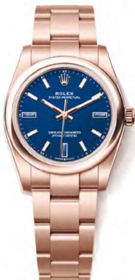
DIE OYSTER PERPETUAL