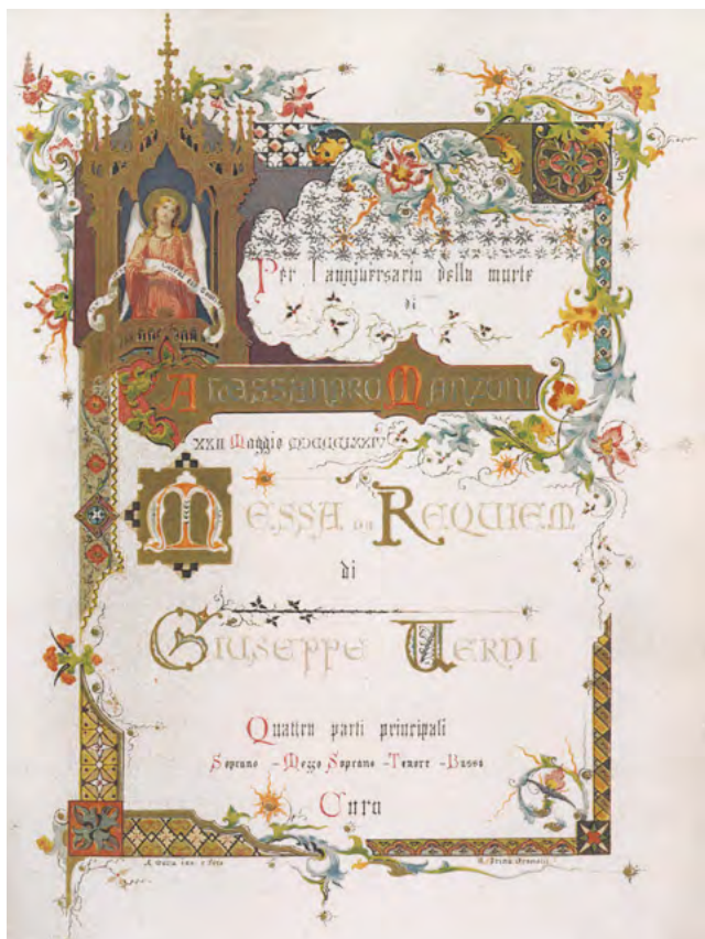
Giuseppe Verdi, Messa da Requiem, Titelblatt der Erstausgabe

Befreie mich, Herr, vom ewigen Tod an jenem furchtbaren Tag, wenn erschüttert werden Himmel und Erde, wenn du dann kommst, die Welt zu richten im Feuer. Befreie mich, Herr, vom ewigen Tod an jenem furchtbaren Tag. Befreie mich.