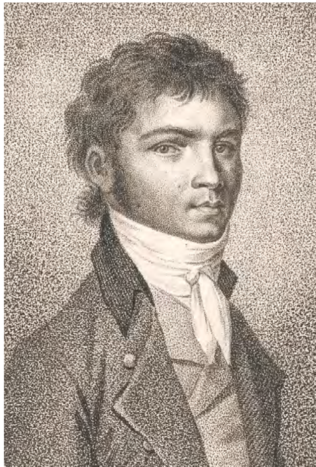
Ludwig van Beethoven 1796 © Stich von Johann Neidl nach einer Zeichnung von Gandolph Ernst Stainhauser von Treuberg

che Gräfin seinerzeit. Und glaubt man Czerny, dann ist er auch verliebt in sie. Eine Behauptung, die sich heute nicht mehr überprüfen lässt. Dass Beethoven aber einen erstaunlich vertrauten Umgang mit der Widmungsträgerin der Es-Dur-Sonate und seines ersten Klavierkonzerts pflegte, bestätigt auch einer ihrer Nefen: „Er hatte die Marotte – eine von den vielen – dass er, da er vis-à-vis wohnte, in Schlafrock, Pantoffeln und Züpfelmütze zu ihr ging und ihr Lectionen gab.“