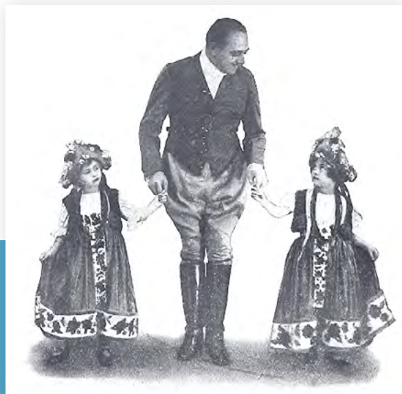
Hubert Marischka als Graf Tassilo in Kálmáns Gräfin Mariza, 1924

Mit Blick auf die Nachfrage entwickelten sich Austausch und Vermischung des Repertoires im 20. Jahrhundert dergestalt weiter, dass 1961 eine Statistik über das Repertoire der Budapester Roma-Musikanten alle gängigen Melodien aus Emmerich Kálmáns Gräfin Mariza verzeichnete. Und auch, wenn in der Erfolgsoperette von 1924 die finanziellen Machtverhältnisse zwischen dem Gutsverwalter (und Edelmann inkognito) Tassilo und den von ihm bezahlten Musikanten klar bleiben: Die emotionale Oberhand wird dem aufspielenden „Zigan“ zugestanden, dessen Kunst eine quasi magische Macht ausübt. Schon 1915 hatte Kálmán mit diesem Bild gespielt, als er seine Csárdásfürstin als