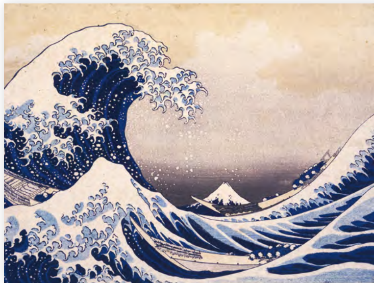
Die große Welle vor Kanagawa des japanischen Künstlers Katsushika Hokusai zierte die Erstausgabe von Debussys La mer .

Claude Debussy , geboren im Jahr des Meistersinger -Vorspiels, stand als Verfechter einer neuen französischen Ästhetik dem Werk Saint-Saëns' wenig freundlich gegenüber. Auch Wagners Musik lehnte er lange ab, musste sich dann aber vom Parsifal doch beeindruckt zeigen, von diesen Orchesterklängen, „die einmalig sind und ungeahnt, edel und voller Kraft.“ Klangfarben im Orchester, das war ja auch Debussys großes Thema. Eines seiner populärsten Werke, das heute gerne als ein Musterbeispiel für den musikalischen Impressionismus angeführt wird, widmete Debussy dem Meer, dem sich der Komponist zeit seines Lebens sehr nahe fühlte: La mer ist dreiteilig und dabei mehr sinfonische Dichtung als Sinfonie, denn für eine solche ist die Musik zu frei in der Form. Debussy nannte sie: Sinfonische Skizzen.