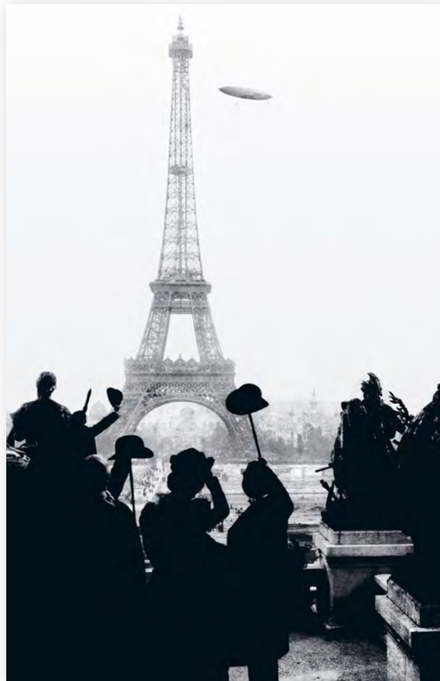
Silhouette des Eiffelturms in Paris mit einem Luftschiff

„Einer der schönsten Tage meines Lebens!“ Ganz weit oben auf der Rangliste der persönlichen Glücksmomente rangiert für Kathia Buniatishvili ein spezielles Datum: Es ist der 17. Februar 2017. Der Tag, an dem die Georgierin zur Französin wird. Seit sechs Jahren hat sie da bereits ihren Lebensmittelpunkt in Paris gefunden – jener Stadt, die schon in Kindertagen ein Sehnsuchtsort für sie ist. Wie Frankreich überhaupt, das Buniatishvili für „seine Menschenrechte, seine Schönheit, seine Kunstbegeisterung und seine Kreativität“ liebt und bewundert. „Ich glaube“, gesteht sie 2019 in einem Interview mit dem Magazin Paris Capital, „ich habe von Frankreich geträumt, seit ich denken kann, und mit 13 habe ich Französisch gelernt. Ich war fasziniert von französischen Filmen, in denen Frauen so frei und schön wirkten, und ich habe von Juliette Binoche und Isabelle Huppert geschwärmt. Ich wollte schon immer