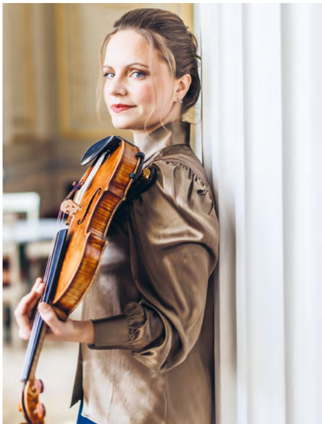
Julia Fischer © Sue Yang