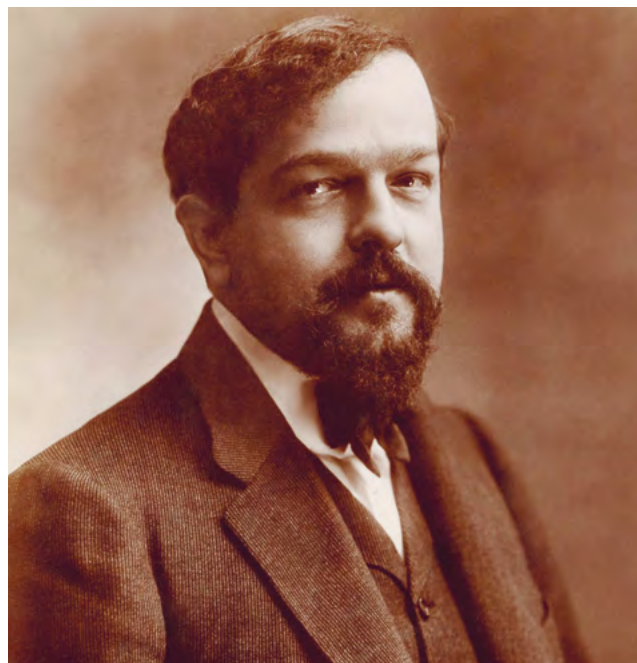
Claude Debussy ca. 1908

Claude Debussys Spezialität? Ganz klar das Schemenhafte. Das Nachmalen einer äußeren Gestalt oder einer Stimmung. Eines Sinneseindrucks oder einer spezifisch-unspezifischen Farbigkeit. „Die Musik ist eine geheimnisvolle Mathematik, deren Elemente am Unendlichen teilhaben“, war sich der 1862 in Saint-Germain-en-Laye nahe Paris geborene Komponist sicher. „Sie lebt in der Bewegung des Wassers, im Wellenspiel wechselnder Winde; nichts ist musikalischer als ein Sonnenuntergang!“ Weil seine Musik Eindrücke von etwas mitteilt, ein subjektives Erscheinungsbild wiedergibt, nannten bereits seine Zeitgenossen sie